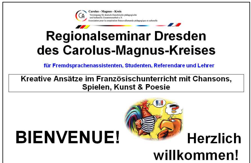
Die beiden Willkommens-Plakate