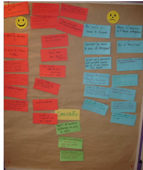
Aufsteller mit Ergebnissen der Gruppenarbeit zum Thema „Erfahrungsaustausch der Assistenten“