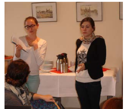
Et enfin ... les résultats! Voici les participants qui présentent leurs séquences de cours qu'ils avaient préparées à la bases des idées du séminaire.