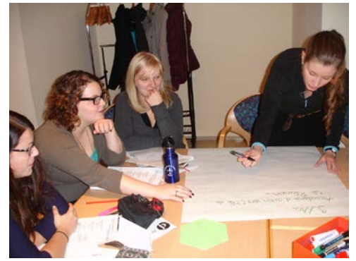
... und einige Ideen wurden auch sofort weiterentwickelt.