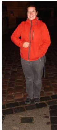
Den Freitag Abend und den späten Samstag Nachmittag nutzten wir für die Entdeckung des Stadtzentrums von Dresden. Ein leichter Schneefall setzte ein, als wir im romantischen Dämmerlicht den Zwinger durchquerten.